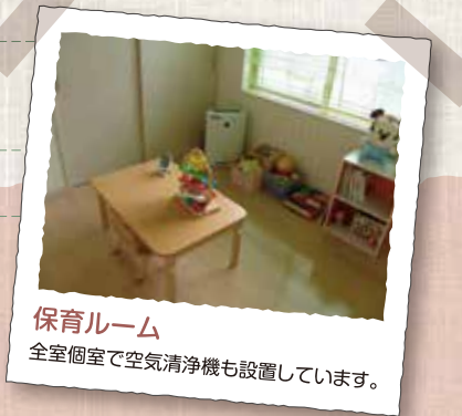
保育ルーム 全室個室で空気清浄機も設置しています。