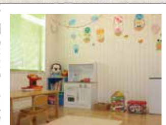
保育ルーム 全室個室で空気清浄機も設置しています。